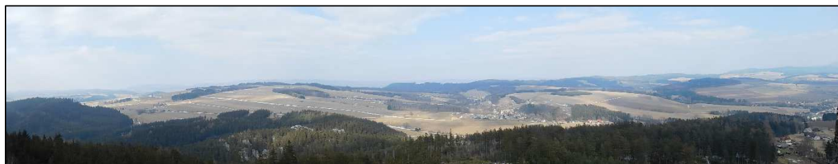
Vyhledka z Ostaše na Pěkov